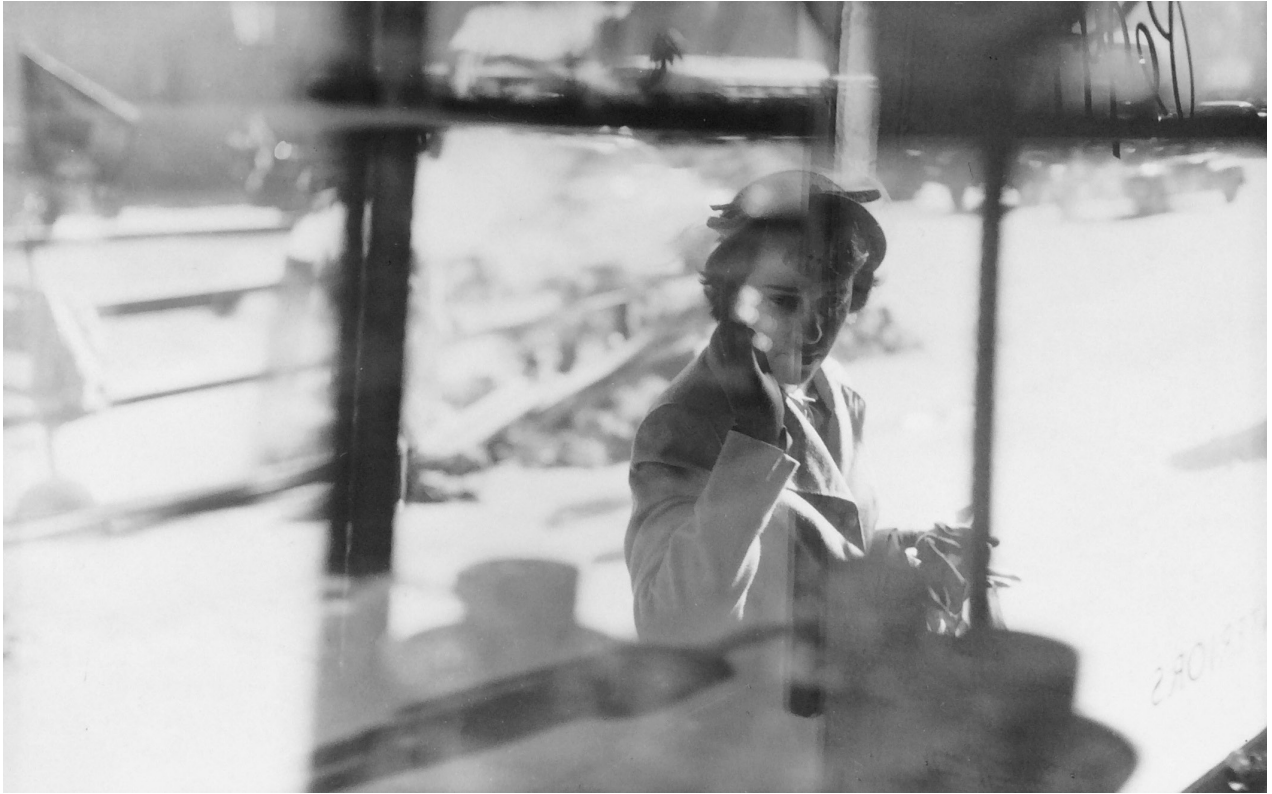
Saul Leiter, Exacta , 1948 © Saul Leiter Foundation