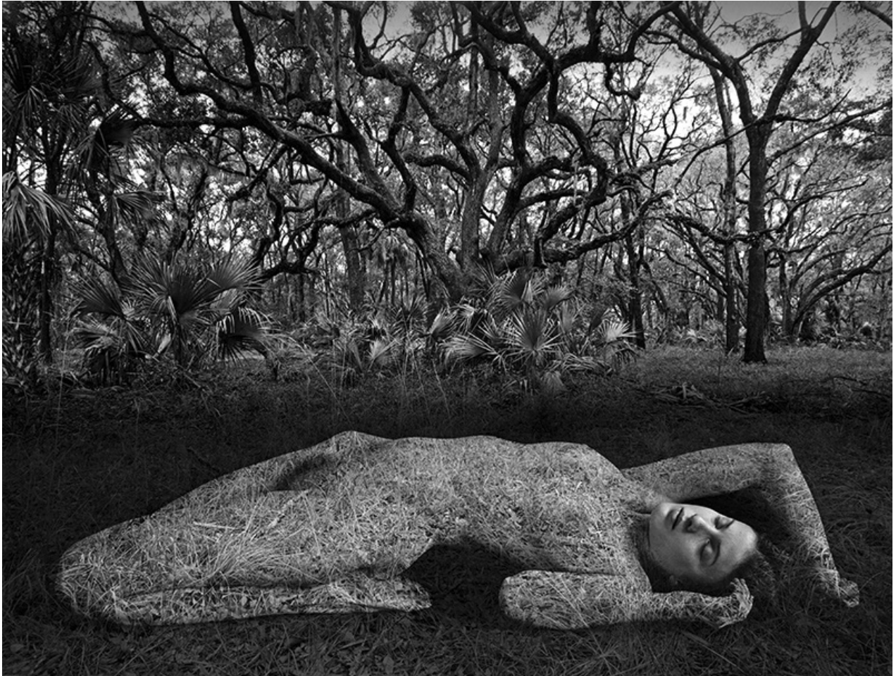
Jerry Uelsmann, Untitled, 1983