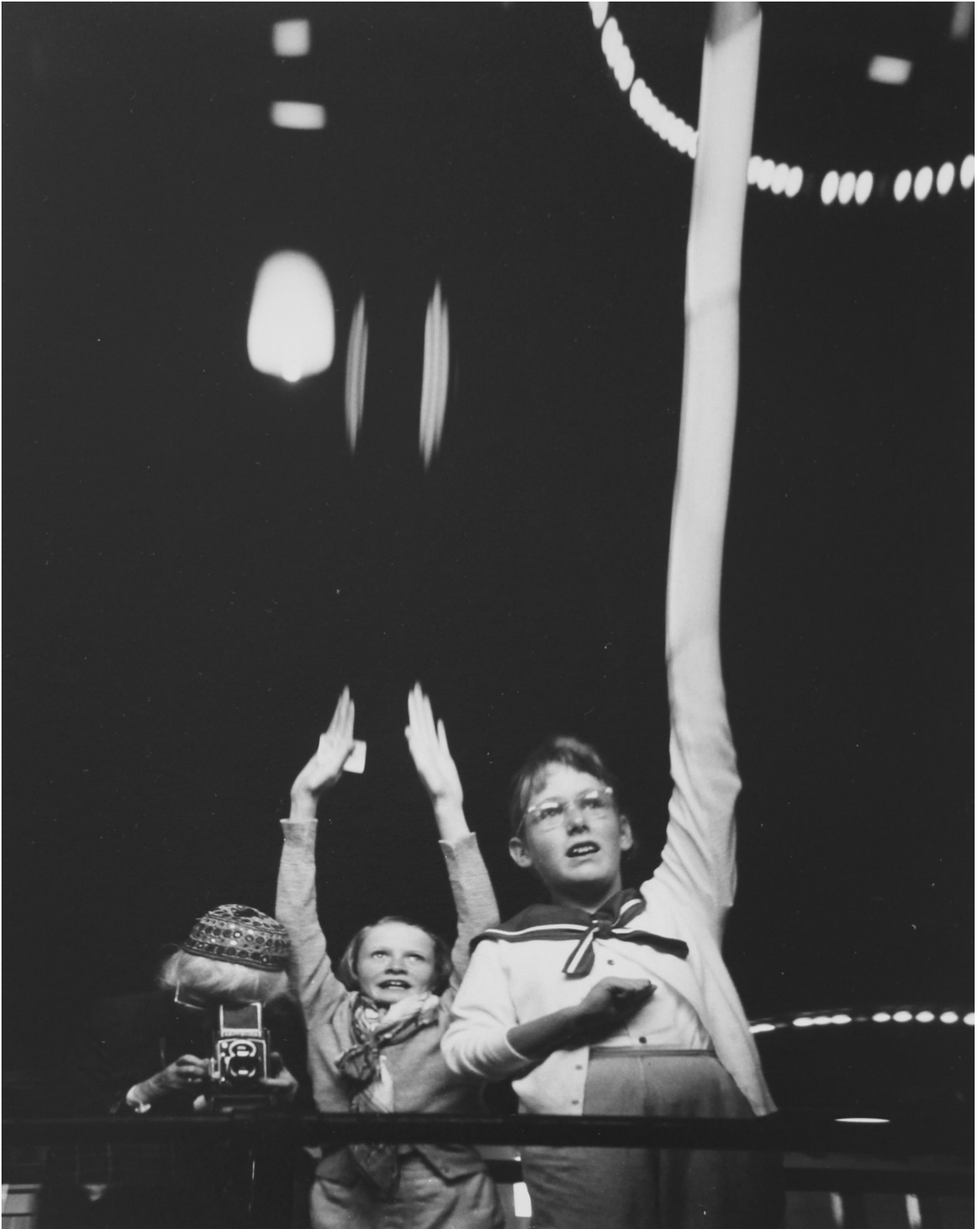
Imogen Cunningham, Self Portrait with Grandchildren in S.F Funhouse, 1955