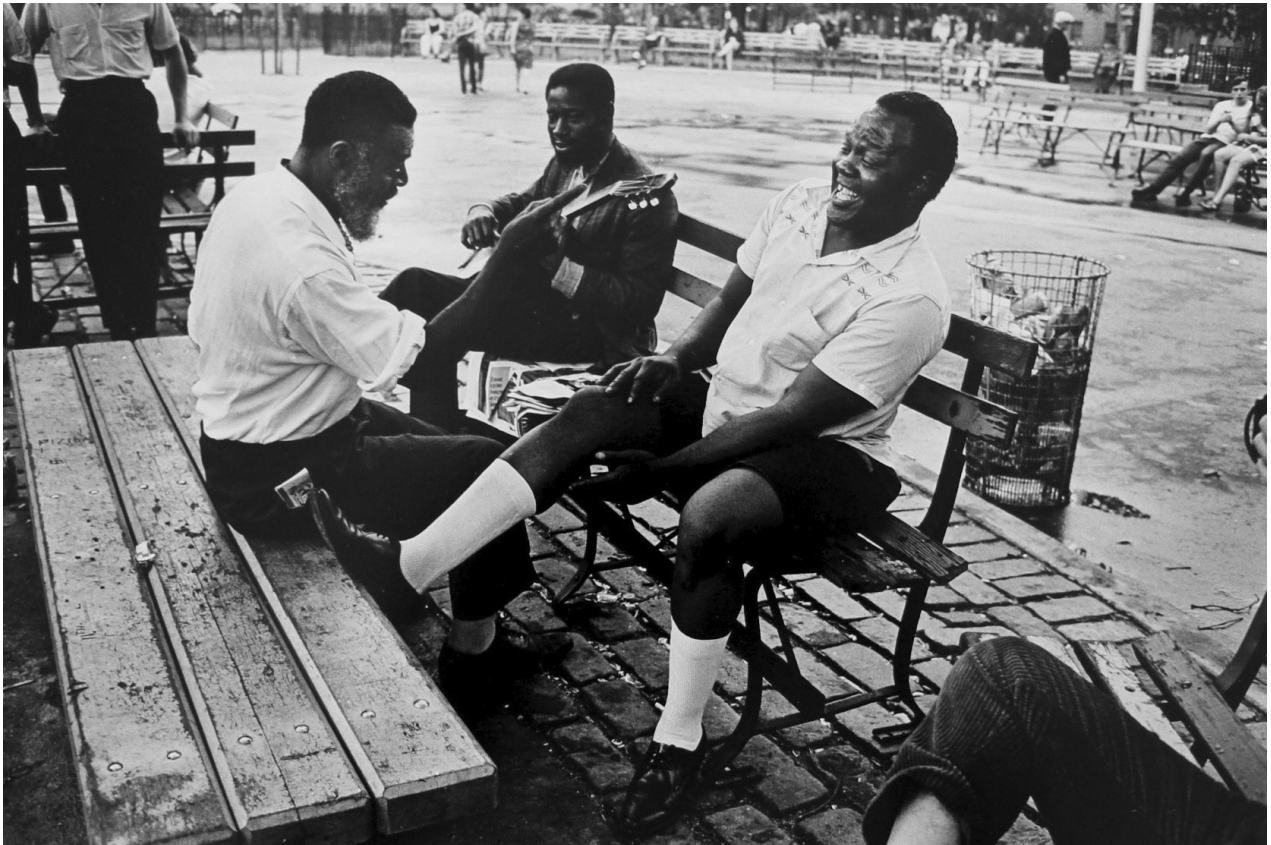
Jill Freedman, Untitled, 1969