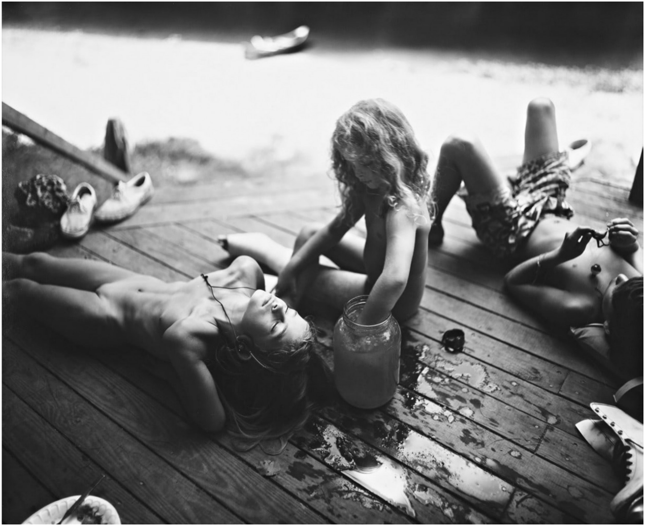
Sally Mann, Listening to Madonna by the Tadpole Jar, 1990