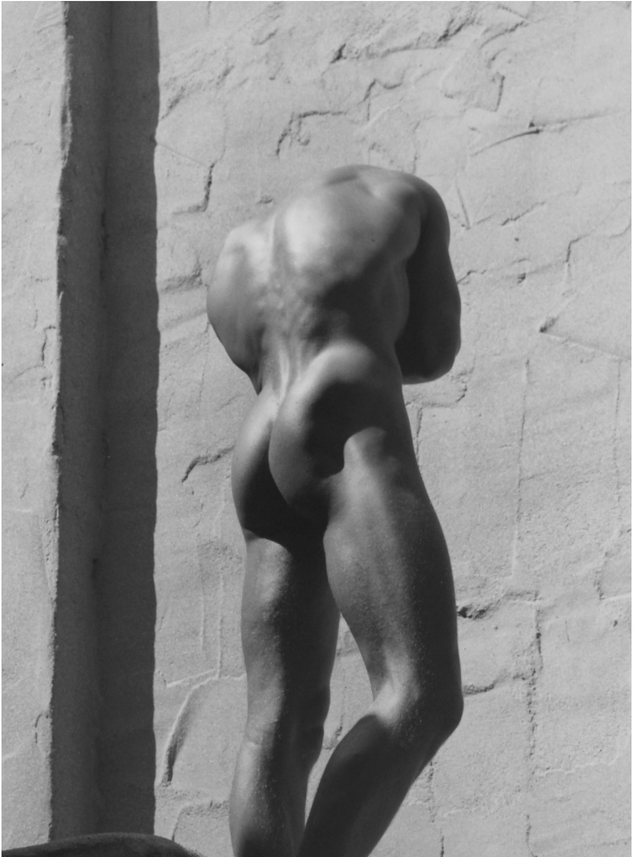
Herb Ritts, Headless Nude, Silverlane, 1984