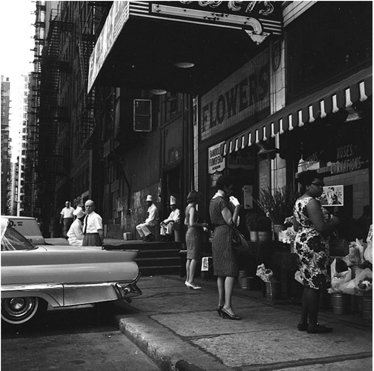
Vivian Maier, Untitled (Flower Shop), 1964 © Estate of Vivian Maier, Courtesy