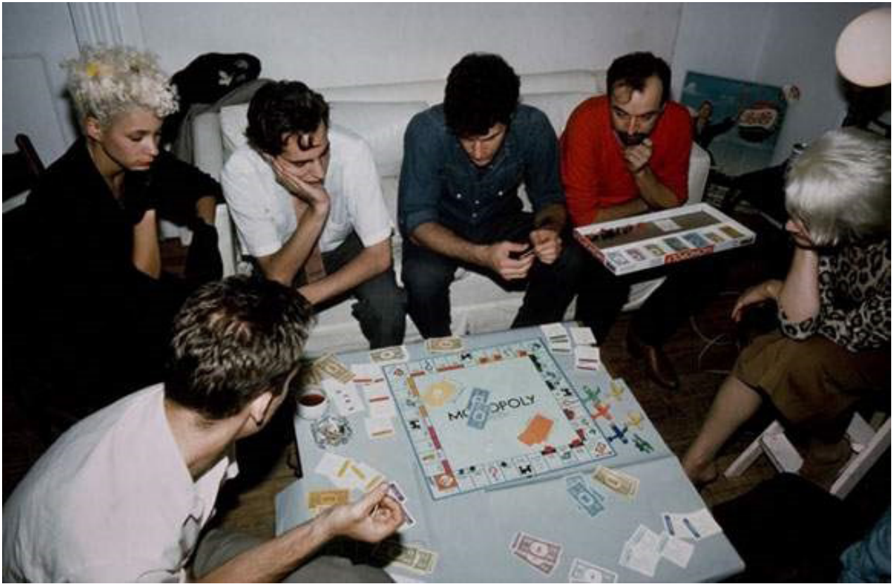
Nan Goldin, Monopoly Game, New York, 1980